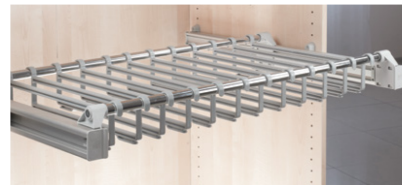
Telai in plastica / Plastic supports / Plastik abstützungen / Soportes de plástico / Supports en plastique