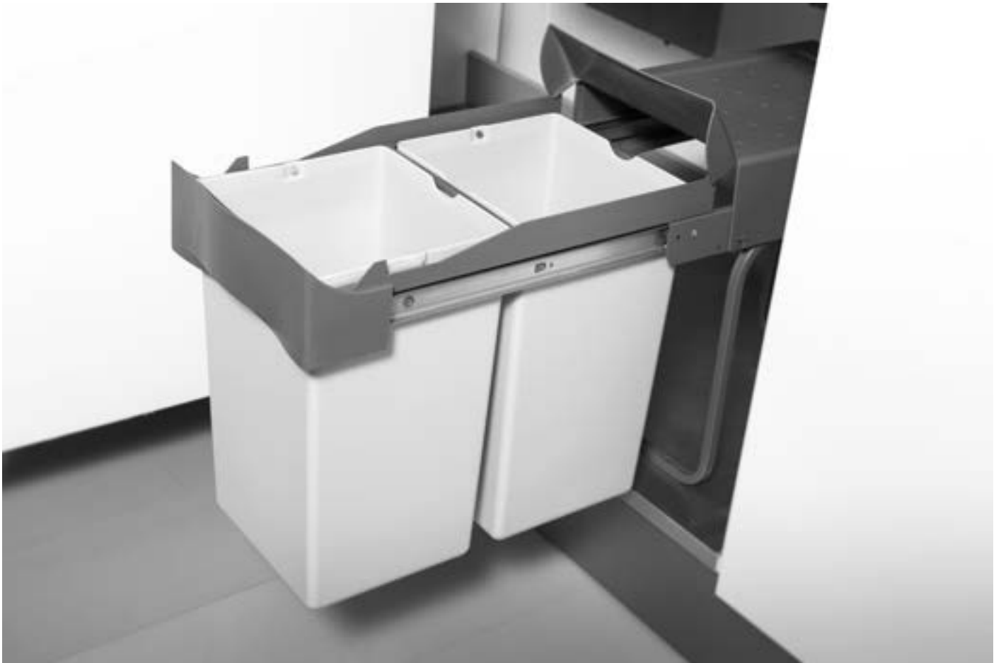
Enrico Tommasini Design

Il coperchio consente l'appoggio di guanti, spugne e piccoli oggetti. The lid allows the rest of gloves, sponges and small objects.