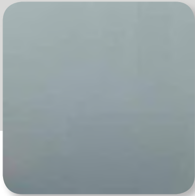
silber glänzend silver gloss