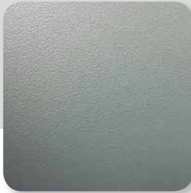
silbergrau genarbt silver grey grained