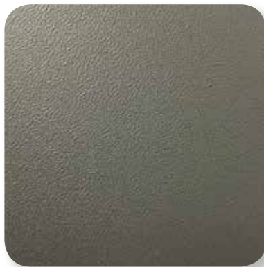
steingrau genarbt stone grey grained