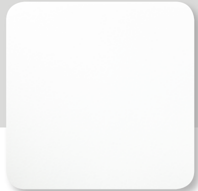
weiß genarbt white grained