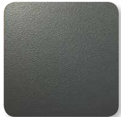
schiefergrau genarbt slate grey grained