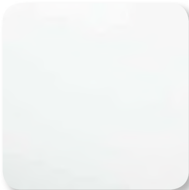
weiß glänzend white gloss