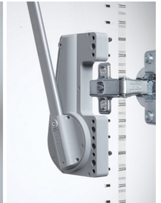
Sagomatura per cerniere / Hinges shape / Profil für scharniere / Horma para goznes / Galbe pour charnières