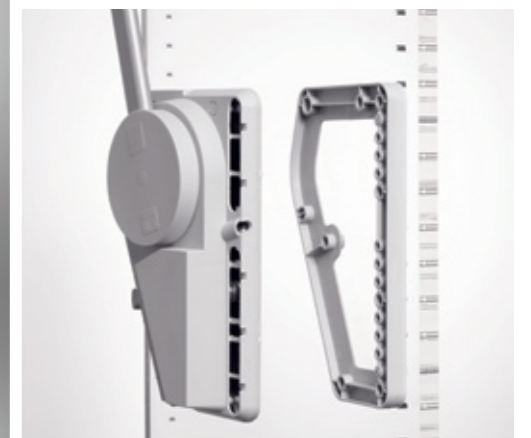
Staffa per muro / Wall clamp / Wandbügel / Abrazadera de muro / Bride pour mur Distanziatore/ Spacer/ Distanzstück/ Espaciador/ Entretoise