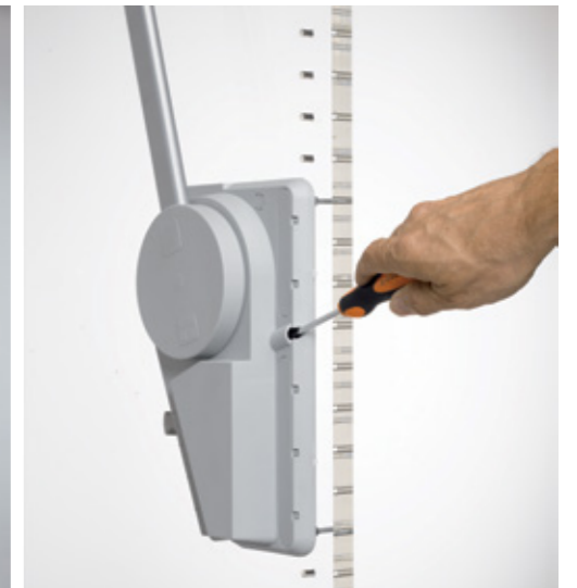
Regolatore di verticalità / Upright regulating device / Senkrechtregler / Ajuste vertical / Réglage vertical